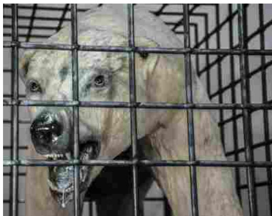
Polar Bear, un'installazione raffigurante un gigantesco orso bianco, prigioniero e a rischio di estinzione

La mostra, curata da Franco Bertoni , architetto, critico d'arte ed esperto di ceramica del Novecento, è inserita nell'ambito del programma del festivalfilosofia di Modena (16-18 settembre 2016). Partendo dal tema della manifestazione, l'agonismo, l'esposizione si sviluppa a partire da Polar Bear, un'installazione raffigurante un gigantesco orso bianco che i maestri della ceramica Giampaolo Bertozzi e Stefano Dal Monte Casoni hanno immaginato ingabbiato, prigioniero e a rischio di estinzione a causa dei mutamenti determinati dall'attività umana.