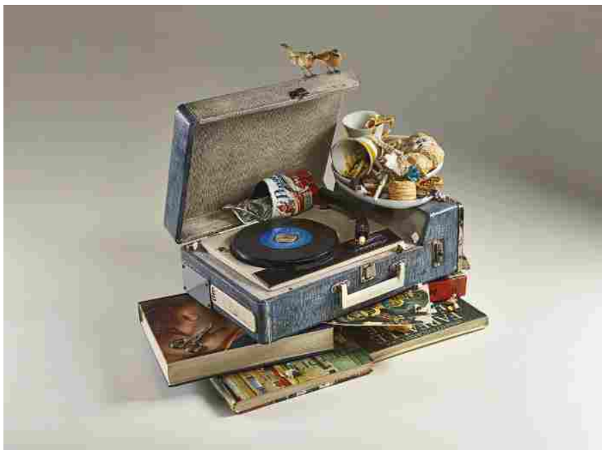
Opere che indicano la dialettica di composizione e decomposizione, morte e rigenerazione

Attorno a questa figura emblematica della lotta evolutiva, altre opere (cestini stracolmi di cartacce e lumache, pile di piatti sporchi, tubature in cui si incastrano oggetti d'uso comune e didascalie) indicano la dialettica di composizione e decomposizione, morte e rigenerazione che attraversano l'esistenza di individui e società, in un continuo pendolo tra consolazioni e desolazioni: sono i rifiuti che ciascuno lascia dietro di sé, piccole estinzioni locali che agitano il mondo delle cose anche nell'epoca dell'abbondanza.